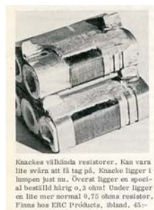
Knackes vilkända resistorer. Kan vara lite svåra att få tag på. Knacke ligger i lampen just nu. Överst ligger en special bestilld härlig 0,3 ohm! Under ligger en lite mer normal 0,15 ohms resistor. Finns hos ERC Products, ibland. 45-