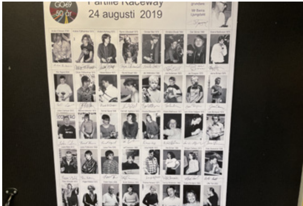
Inne i klubblokalen finns en slags "wall of fame" där det finns bilder från förr på klubbens medlemmar. Några av dem är fortfarande där regelbundet.