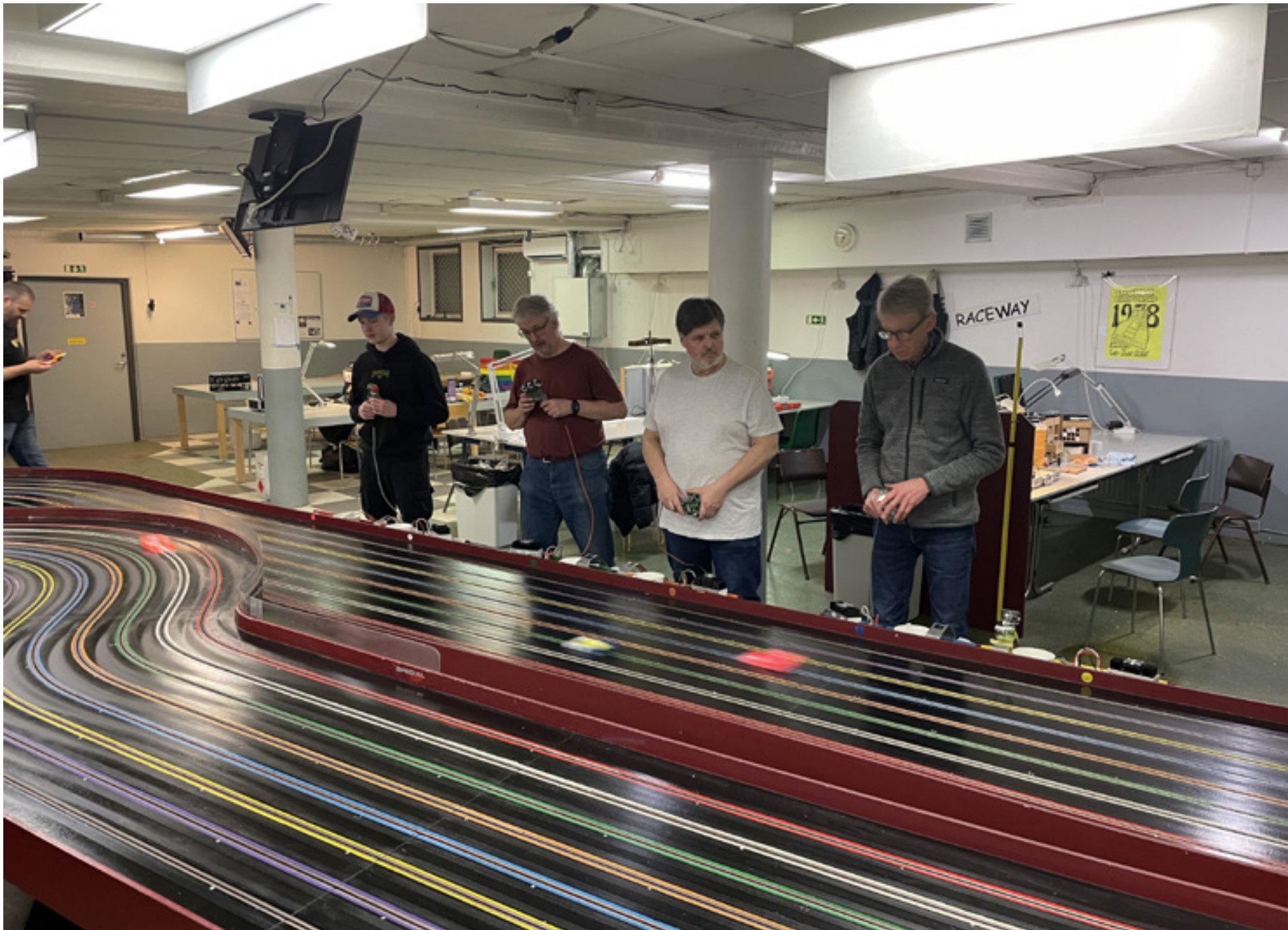
När racet väl är igång är det svårt att se bilarna. Ofta går förarna på ljudet, för att avgöra hur fort bilarna går och var de befinner sig.